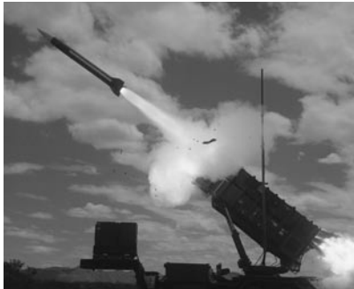
Nuestra portada: Estados Unidos está abasteciendo de proyectiles Patriot a Polonia, en un trato que cerraron el 20 de agosto.