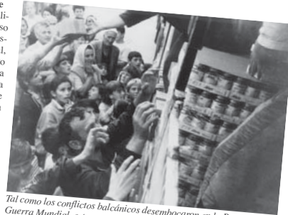
Tal como los conflictos balcánicos desembocaron en la Primera Guerra Mundial, esta región sirve hoy a los propósitos geopolíticos de los británicos. Refugiados bosnios reciben comida durante la guerra de los Balcanes (1995). (Foto: Bosnische Hilfgüter Zenica).