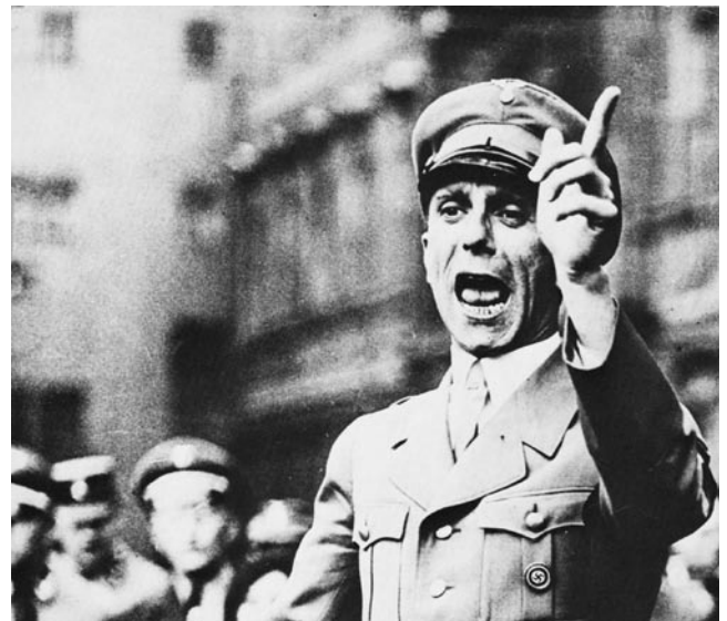
El ministro de Propaganda nazi Joseph Goebbels hubiera envidiado la “gran mentira” que escupen los hipócritas de Occidente contra China hoy.

Que un político a favor de la ratificación del tratado de