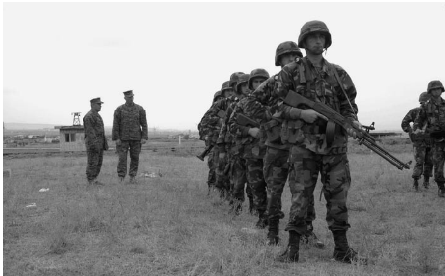
Georgia ha resultado ser un instrumento voluntario de la estrategia angloamericana para acorralar a Rusia. El 8 de agosto estalló la guerra entre fuerzas rusas y georgianas. Infantes de marina estadounidenses preparan a reclutas del Ejército georgiano en el Campo de Entrenamiento Krtsanisi, en 2003. (Foto: A1C Dallas D. Edwards/Fuerza Aérea de EU).

Nada más lejos de la verdad. En febrero pasado, cuando la Unión Europea (UE) —integrada por Gran Bretaña, Fran- cia y otras naciones— apoyó la declaración de independen- cia unilateral de Kosovo, ya era claro que esta medida deses- tabilizadora no sólo afectaría a los países balcánicos, pero también alentaría cuanto movimiento separatista y de mino-