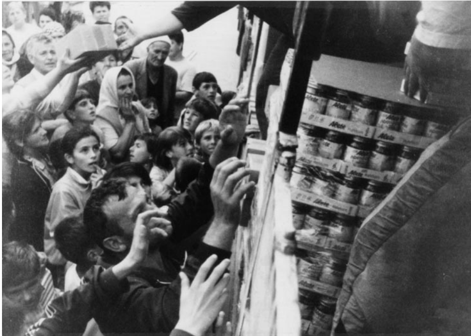
Tal como los conflictos balcánicos desembocaron en la Primera Guerra Mundial, esta región sirve hoy a los propósitos geopolíticos británicos. Refugiados bosnios reciben comida durante la guerra de los Balcanes (1995).

estuvo destacado en Irlanda del Norte, Ucrania, Armenia y Georgia, todos países con problemas de nacionalidades y minoría étnicas.