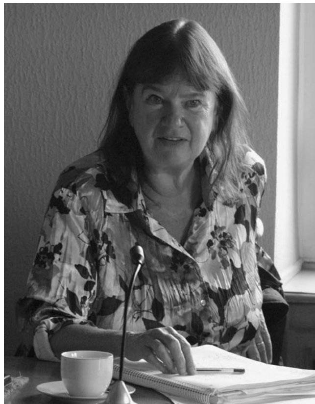
Helga Zepp-LaRouche ha llamado a una movilización internacional a nombre de “los objetivos comunes de la humanidad”...

Y Martin Luther King le recordó al mundo el 28 de agosto de 1963, en su famoso discurso “Tengo un sueño”: “Cuando los arquitectos de nuestra república escribieron las magníficas palabras de la Constitución y de la Declaración de Independencia, firmaron un pagaré del que todo estadounidense habría de ser heredero. Este documento era la promesa de que a todos los hombres, sí, al hombre negro y al hombre blanco, les serían garantizados los inalienables derechos a la vida, la li-