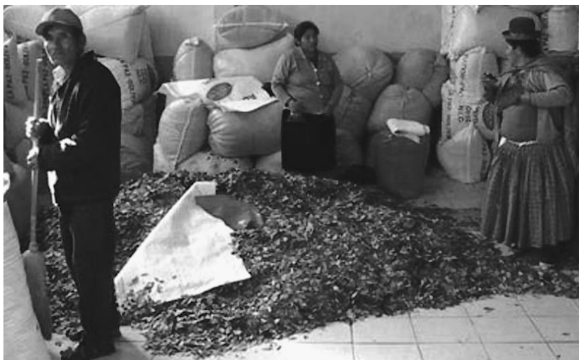
Cosecha de hoja de coca en Perú. El argumento científicamente fraudulento de que la coca es nutritiva salió —¿de dónde más?— de la Universidad de Harvard, en 1975.

El método “científico” de Harvard sólo es superado, en su necesidad, por las investigaciones de los llamados miembros de la “antropología participante”, que basan sus investigaciones en encuestas en las que se pregunta al campesino o minero andino por qué consume la hoja de coca. La respuesta predominante y esperada es: “Porque quita el hambre”. Ante ello, es-