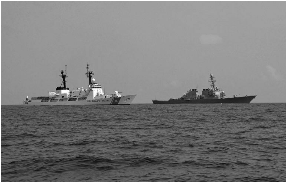
Un guardacostas y un destructor de la Armada estadounidense con proyectiles teledirigidos zurcan el mar Negro el 26 de agosto, en abierta provocación contra Rusia, para llevar provisiones de ayuda a Georgia.

—una crisis causada por él personalmente—, no hay duda de que quiere preparar al mundo para el gran estallido.