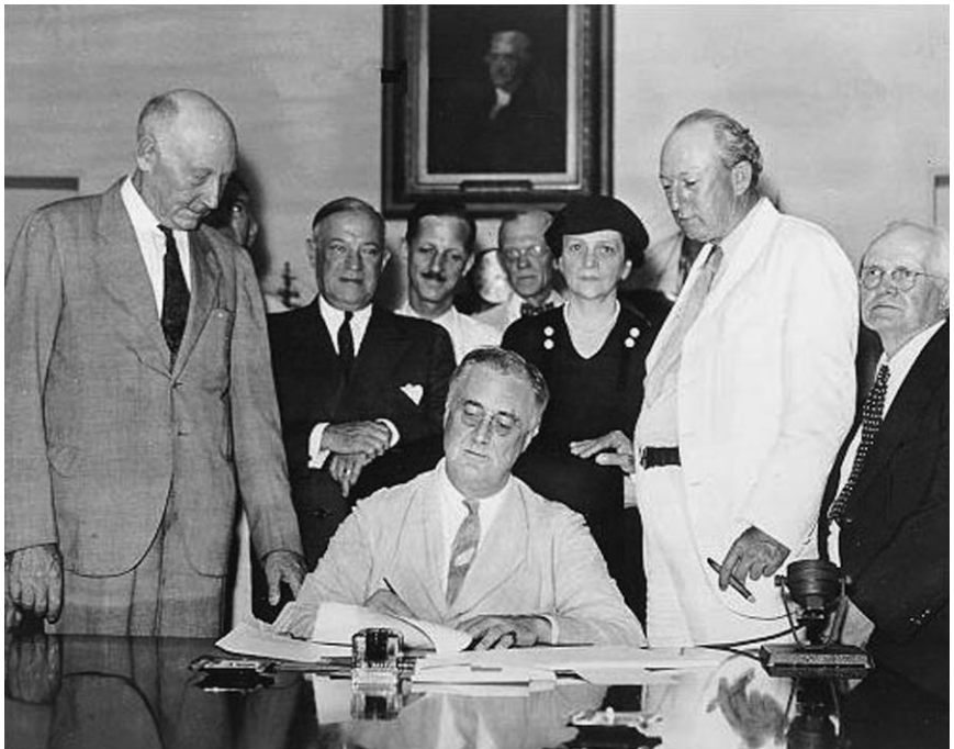
El presidente Franklin Delano Roosevelt firma la ley del Seguro Social de 1935, que fue el sello distintivo del Nuevo Trato. El ministro de Relaciones Exteriores ruso Serguéi Lavrov invocó el ejemplo de Roosevelt al escribir la clase de medidas económicas que se necesitan hoy.

Según Lavrov, el modelo anglosajón (es decir, librecambista) se tambalea, igual a como sucedió en los 1920, y, por tanto, hoy como entonces, es necesario el Nuevo Trato de Franklin Roosevelt. Debe integrarse a China, India, Rusia y Brasil en esta nueva reforma de nuestras instituciones internacionales. Sobre esta base puede planificarse un futuro común para la región euroatlántica y el mundo entero, un futuro en el que la seguridad y la prosperidad se harán realmente inseparables, asevera.