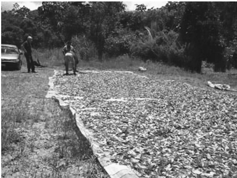
Hojas de coca se secan a un lado de la carretera en la región del Chapare en Bolivia.