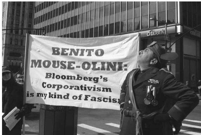
El ratoncillo fascista Benito Ratolini recorrió las calles de Nueva York el 29 de febrero como parte del despliegue político de LaRouche PAC, pero al alcalde de la ciudad y admirador de Mussolini, Michael Bloomberg, no le hizo ninguna gracia.