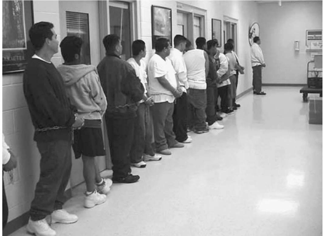
Immigrantes iberoamericanos esperan su deportación de EU. La economía dolarizada de Ecuador depende de las remesas que los inmigrantes envían a sus familias, y el desplome del dólar afectará enormidades el nivel de vida de su población.

Y esto ya se empieza a reflejar en el hecho de que hay una disminución, más allá de las políticas estatales o de las políticas del gobierno de turno, que hay una disminución del peso de los Estados Unidos