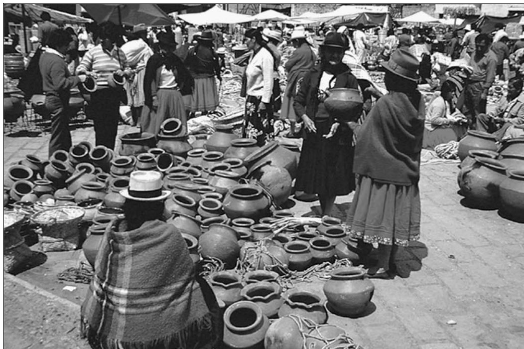
Ecuador, dijo Páez, pretende romper con las directrices neoliberales, y restaurar una política de desarrollo y producción. Mercado en Ecuador. (Foto: Metropolitan Touring).

relación, que ubique el aporte civilizatorio que han hecho los Estados Unidos; que genere elementos nuevos, por ejemplo de cooperación cultural, de cooperación técnica, de mejor relación en lo que tiene que ver con los emigrantes, para evitar los abusos ante los emigrantes; que permita que los Estados Unidos, de una vez por todas, definan los pedidos de extradición de los banqueros corruptos que están en Miami, por ejemplo; que permita a nuestros compatriotas allá no se les trate como ilegales, como criminales; que permita que haya relaciones mucho más equitativas en la inversión y que permita realmente el desarrollo; que permita romper conjuntamente este esquema especulativo y rentista basado solamente en la cuestión financiera, y que no define condiciones nuevas superiores de producción.