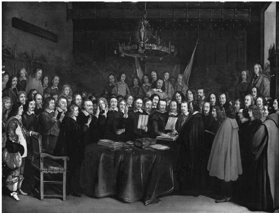
"En 1648 se introdujo la Paz de Westfalia, en la que el principio cristiano del beneficio del prójimo se adoptó como la base de la paz. Necesitamos Estados nacionales soberanos... Tenemos que regresar al concepto del Tratado de Westfalia", afirma LaRouche.

Si los Estados Unidos deciden defenderse, irán donde Rusia, China e India para cooperar, y movilizarán a un grupo de naciones para poner fin a esta cosa. Si se logra que un número de potencias mayores del mundo coincida en que hay que cambiar el sistema para salvar a la civilización misma, entonces sí se puede ganar. Yo veo una disposición a favor de eso de parte de China y de otros países. Tengo apoyo creciente para esto dentro de los Estados Unidos. Es posible ganar. Y, como en la guerra, no hay alternativa a la victoria.