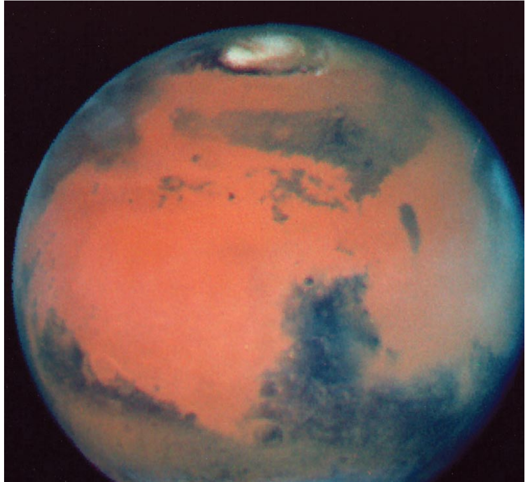
Marte, visto desde el telescopio espacial Hubble. (Foto: NASA).

Esto define experimentos mentales apropiados que casan con las capacidades psicológicas de una personalidad de tipo “B”, pero no de tipo “A”. La idea de una relatividad física verdadera, cuando lo “grande” se considera primero, en aproximación, desde una perspectiva riemanniana en lo muy grande y lo muy pequeño, como en relación con las alternativas ópti-