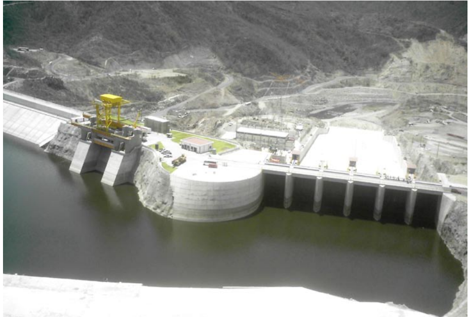
La presa El Cajón en el estado de Nayarit, una zona abundante en agua, sería parte del PLHINO para reverdecer el árido norte del país. El PLHINO no podrá construirse nunca sin un amplio apoyo nacional, ni sin antes derrotar al Imperio Británico.

Veán la situación de la frontera, el problema que abordamos en ese entonces es que el área de las costas de México, especialmente en el