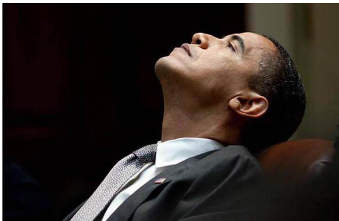
El presidente Obama encara decisiones sumamente delicadas.

“La política de Barack Obama es genocidio contra el pueblo de Pasa a la página 4