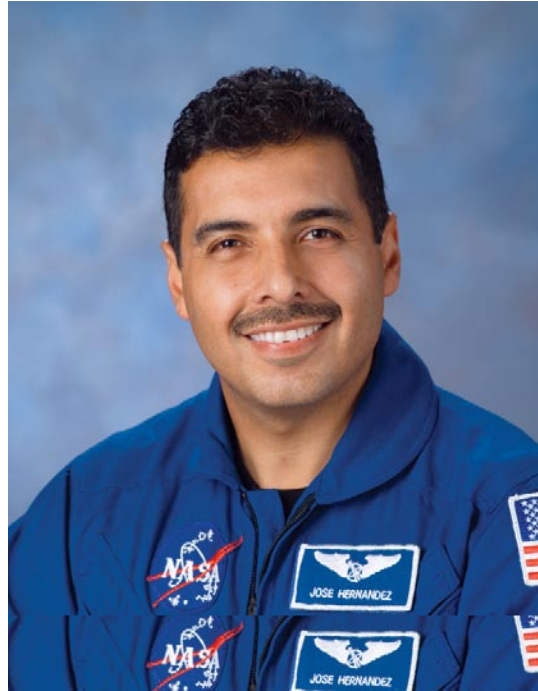
El astronauta José Hernández, un mexicano-estadounidense de primera generación, está decidido a ayudar a México a iniciar su propio programa espacial. (Foto: NASA/Centro Espacial Johnson).

como enlace para ayudar en todo lo necesario. Insistió mucho —aun cuando Calderón salió con un “claro, claro que sí”, pero el problema es la “situación económica”— que una agencia espacial es un activo económico para una nación.