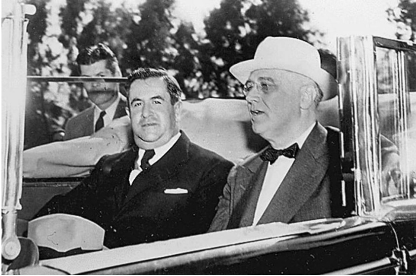
Los presidentes de México, Manuel Ávila Camacho, y Estados Unidos, Franklin Delano Roosevelt, se reúnen en Monterrey, México, el 20 de abril de 1943. Roosevelt pensó a escala global y estratégica cómo destruir al enemigo; una enseñanza para nosotros.

ble y con la menor pérdida de vidas de ambos lados. ¿Por qué? Porque McArthur no era un necio, como lo son la mayoría de los generales y comandantes en jefe aficionados de todo el mundo hoy en día.