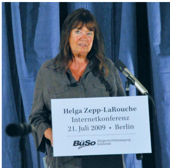
Helga Zepp-LaRouche anuncia el 21 de julio, desde Berlín, su candidatura a canciller de Alemania por el partido Movimiento de Derechos Civiles Solidaridad (BüSo).

Zepp-LaRouche también es la única candidata que propone usar más energía nuclear, transformar el sistema de transporte colectivo a través de nuevas tecnologías, como los trenes de levitación magnética, y adoptar principios sólidos para el crecimiento de la economía física.