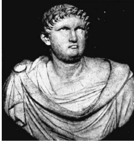
El emperador romano Nerón.

rrido el bombardeo nuclear de Hiroshima y Nagasaki, ni “Guerra Fría”, de no haber muerto Roosevelt. Se hubiera desintegrado el sistema colonial del mundo poco después de la conclusión de la guerra. El Reino Unido habríase convertido en una nación próspera, pero no en un imperio.