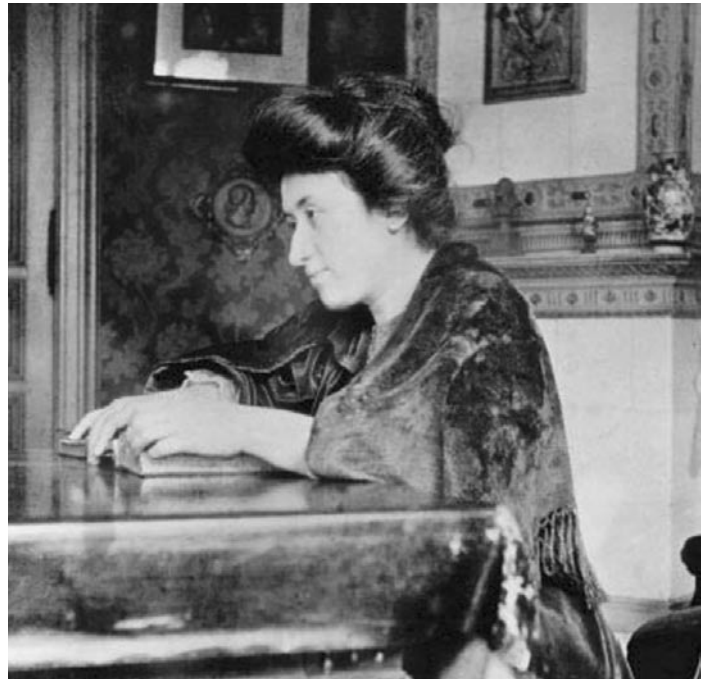
La socialista polaco-germana Rosa Luxemburgo captó la naturaleza del imperialismo moderno.

Por último, el Gobierno de Obama. En Estados Unidos ahora hay en marcha una especie de fenómeno que afecta alrededor del 80% de la población; un fenómeno como el que describió una mujer famosa, Rosa Luxemburgo. Ahora está desarrollándose en EU, desde el mes de agosto, algo que también tuvimos en Alemania Oriental, especialmente