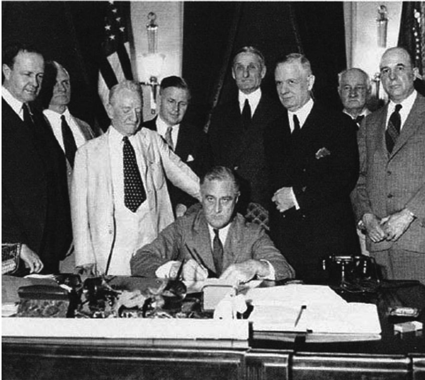
El presidente Franklin Roosevelt firma la ley bancaria Glass–Steagall en 1937. A su derecha, de pie, aparece el senador Carter Glass y a su izquierda el representante Henry Steagall.

que propuse entonces, allá por 2007. Ahora tenemos una crisis generalizada, que puede acabar, como en reacción en cadena, con el planeta entero. Porque tenemos pendiente una masa de deuda producto de derivados financieros encima de derivados financieros sobre derivados financieros, misma que, si ocurre el proceso de desplome, acabará con todo el planeta, pero por una razón muy especial: anteriormente, cuando teníamos un sistema de Estados nacionales soberanos, contábamos hasta con 80% de lo necesario para sobrevivir dentro de la nación, producido en la nación. Pero, con el proceso de globalización ya no tenemos esa seguridad.