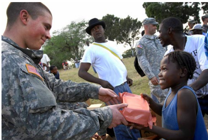
Un soldado de EU reparte alimentos entre los damnificados del terremoto haitiano. (Foto: Departamento de Defensa de EU).