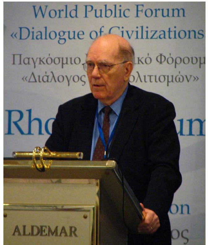
En su discurso ante el Foro de Rodas, LaRouche planteó su propuesta de una alianza entre las cuatro potencias: China, Estados Unidos, India y Rusia.

En vista de la brevedad del tiempo, me limitaré a cierto aspecto del problema. El 25 de julio del año 2007, di conocer un pronóstico por medio de una videoconferencia internacional, que llevé a cabo en ese entonces. En ese momento, en esa fecha, dije que estábamos al borde de una crisis generalizada del sistema financiero de Estados Unidos. Dije que iba a estallar en cuestión de días, y así fue. Lo que se conoció como la crisis hipotecaria, pero que era algo más que una crisis hipotecaria: fue el principio de un proceso que continúa hasta el día de hoy, de una desintegración general de la economía de EU en su forma actual. Es una crisis que amenaza al mundo entero, porque si Estados Unidos, con su enorme deuda, se desploma, si la deuda de Estados Unidos, por ejemplo con China, se desploma en valor a casi cero, lo que puede suceder, iniciaría una reacción en cadena por todo el sistema mundial, lo que sería una crisis comparable a la que experimentó Europa durante el siglo 14. Es de lo más serio.