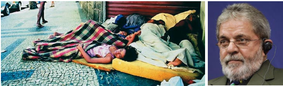
El Presidente de Brasil Lula da Silva (derecha) ha sido un juguete de los brujos británicos, durante sus siete años en el cargo. Bajo su influjo, Brasil ha pagado la asombrosa cantidad de $870,000 millones de dólares en intereses sobre el acarreo de fondos, y ha hundido a los brasileños en la miseria económica, como se ve en esta foto de niños de la calle sin hogar.