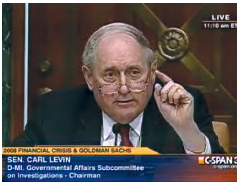
“En las audiencias que presidió el senador Carl Levin de EU, quedó claro que Goldman Sachs estafó a sus propios clientes”.

Al mismo tiempo, la burocracia europea forzó a los gobiernos de Alemania y Francia a aportar fondos de sus contribuyentes para prestarle al Gobierno de Grecia, para que éste le pague a los banqueros. Eso significa transferir el hueco que tienen los bancos a los ministerios de Hacienda de Alemania y Francia, deudas que terminarían pagando los