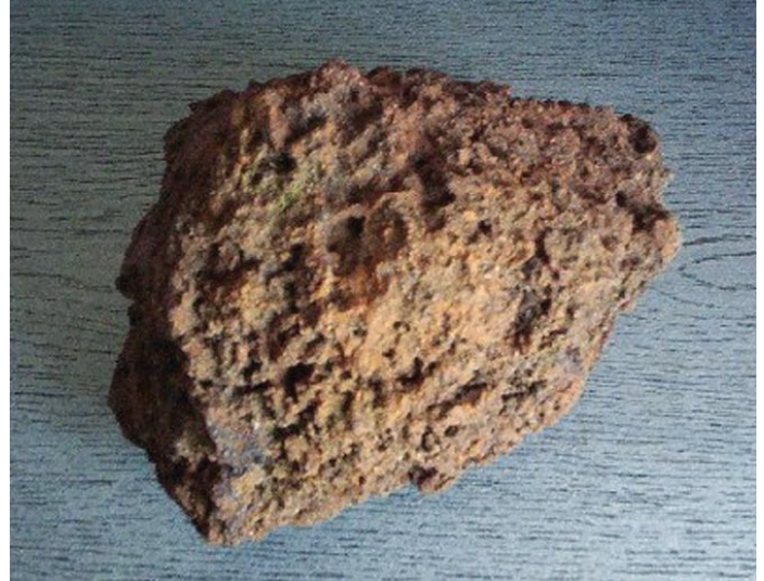
Un ejemplo del concepto de Vernadsky de migración biogénica de átomos: el hierro pantano se produce en varias fases mediante la acción de la biosfera, culminando en la creación de óxidos de hierro mediante la acción oxidante de la bacteria de hierro. (Foto: Wikipedia Commons).

Uno de los mayores problemas a resolver será la cuestión de producir el tipo de ambiente artificial requerido para que la humanidad deje su “vientre materno” aquí en la Tierra. ¿Qué vamos a necesitar llevarnos de la biosfera? ¿Cuál será el papel de los fenómenos electromagnéticos y de la radiación cósmica en ese medio ambiente? Quizá será aconsejable simular el medio ambiente gravitacional de la Tierra, acelerando las naves por el espacio interplanetario a una aceleración igual a la gravedad de la Tierra (1-G), pero esta será la primera vez que tal acto premeditado de aceleración constante haya ocurrido en cualquier lugar del universo. Representará la primera creación artificial de un campo gravitacional sostenido, que si se mantiene por largos períodos de tiempo, resultará rápidamente en velocidades relativistas. ¿Cuál será el efecto de este tipo de viaje sobre la tripulación? ¿Cuál será el efecto en el universo físico de manera más general? Estas cuestiones nos llevan