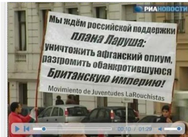
“Miembros del LYM de Argentina reciben a Medvédev en Buenos Aires con un cartel que dice en ruso: “Queremos que Rusia apoye el plan LaRouche: A bombardear los campos de opio de Afganistán; derrotemos al quebrado Imperio Británico”.

LaRouche se refirió a la reciente visita de la secretaria de Estado de Estados Unidos, Hillary Clinton, a la presidenta Cristina Fernández de Kirchner, en la que Clinton, a despecho de los británicos, instó a la Gran Bretaña a negociar con la Argentina sobre las Islas Malvinas. LaRouche dijo que como lo demuestra la secretaria Clinton, la solidaridad entre EU y Argentina es natural, “porque nosotros, en las Américas, tenemos en esencia un interés histórico en la independencia de todos nuestros países como un asunto continental, y tenemos que luchar por asociarnos, en tanto unidad, para defendernos de este problema que nos viene de los británicos”.