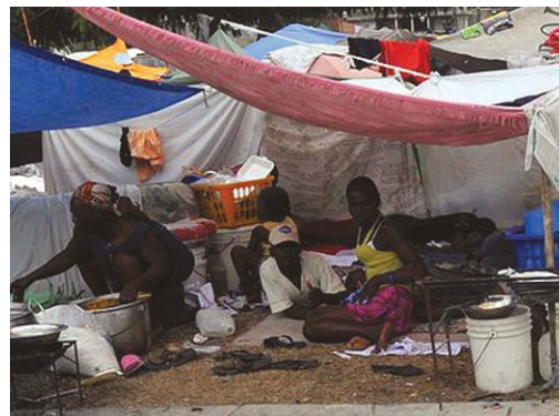
Víctimas del desastre del neoliberalismo en Haití.

El presidente Preval y el primer ministro Jean-Max Bellerive, presentaron un resumen del plan de reconstrucción del Gobierno haitiano. En su primera fase el enfoque será construir nuevos centros de desarrollo regional, donde será necesario establecer o consolidar “infraestructura económica grande, como parques industriales, grandes instalaciones colectivas tales como hospitales y universidades nacionales”. Haití tuvo autosuficiencia alimentaria antes y puede tenerla de nuevo. El plan hace énfasis en la gestión de aguas, la generación eléctrica, la educación, la salud pública, la creación de empleos, y dice que el Estado: “debe crear esperanza y debe afirmar su legitimidad como líder del proceso de reconstrucción