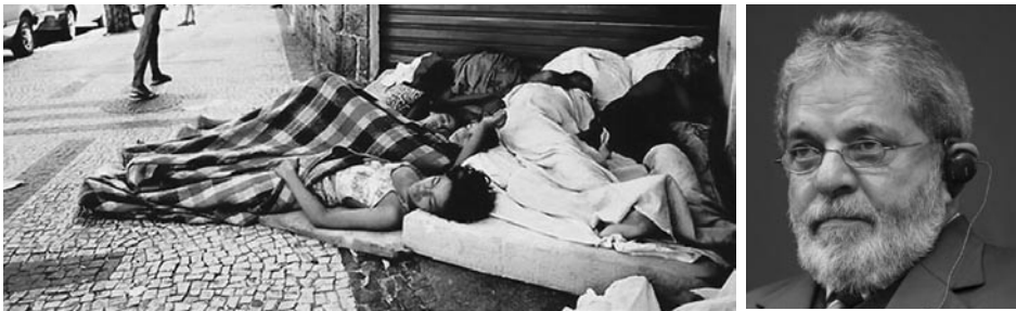
El Presidente de Brasil Lula da Silva (derecha) ha sido un juguete de los brujos británicos, durante sus siete años en el cargo. Bajo su influjo, Brasil ha pagado la asombrosa cantidad de $870,000 millones de dólares en intereses sobre el acarreo de fondos, y ha hundido a los brasileños en la miseria económica, como se ve en esta foto de niños de la calle sin hogar.

En su edición fechada el 5 de marzo de 2010, la revista Executive Intelligence Review describió las operaciones de acarreo de divisas de Brasil como una estafa de pirámide financiera. EIR le explicó a sus lectores extranjeros el infame incidente de Ronaldo, que los brasileños tan bien conocen, cuando el célebre futbolista se vio involucrado con tres transvestistas. “Las cosas no siempre son lo que parecen”, advirtió EIR , especialmente a Rusia, China e India. “No sea que lo engañen como a Ronaldo, el acarreo de divisas, como ‘Andreia’, no es lo que parece ser”.