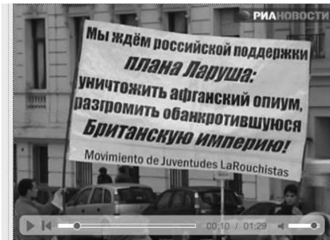
“Miembros del LYM de Argentina reciben a Medvédev en Buenos Aires con un cartel que dice en ruso: “Queremos que Rusia apoye el plan LaRouche: A bombardear los campos de opio de Afganistán; derrotemos al quebrado Imperio Británico”.

LaRouche se refirió a la reciente visita de la secretaria de Estado de Estados Unidos, Hillary Clinton, a la presidenta Cristina Fernández de Kirchner, en la que Clinton, a despecho de los británicos, instó a la Gran Bretaña a negociar con la Argentina sobre las Islas Malvinas. LaRouche dijo que como lo demuestra la secretaria Clinton, la solidaridad entre EU y Argentina es natural, “porque nosotros, en las Américas, tenemos en esencia un interés histórico en la independencia de todos nuestros países como un asunto continental, y tenemos que luchar por asociarnos, en tanto unidad, para defendernos de este problema que nos viene de los británicos”.