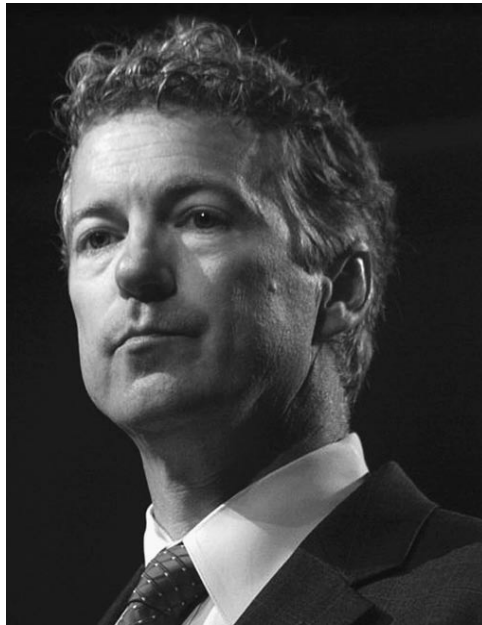
Rand Paul, senador electo por Kentucky.

Tenemos que remontarnos a algo que no es un partido. Tenemos que fijarnos en la nación, y en el significado de nuestra Constitución federal, que es algo que nos distingue de Europa en términos de nuestro legado. Tenemos que remontarnos a personajes tales como el presidente Franklin Roosevelt, a personajes como Abraham Lincoln y a otros que fueron grandes héroes en su momento. Y esos fueron los que encabezaron, después de Benjamín Franklin, después de otros, la creación de esta nación para beneficio del mundo, tal y como Franklin Roosevelt entendió esta misión. Existimos no sólo para beneficio de Estados Unidos sino para beneficio del mundo, porque, si Estados Unidos cae—y puede caer en las próximas semanas— [el mundo cae]. Nos encontramos en un proceso hiperinflacionario, y bajo el presente sistema de