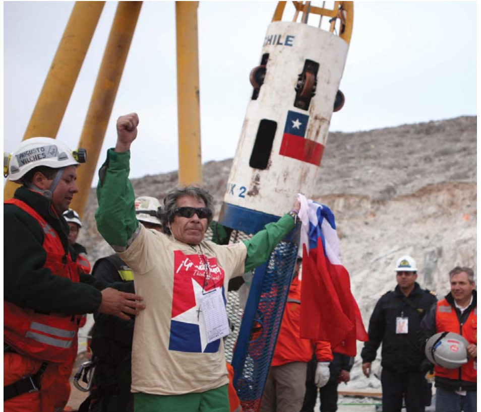
Mineros rescatados salen del tubo de rescate de 66 cm de diámetro, construido según recomendaciones de la NASA.

El papel de la NASA fue decisivo para asegurar el éxito de la movilización. NASA inmediatamente ofreció ayuda con dos aspectos de la crisis: primero, una vez que se estableció que los mineros estaban vivos, ayudó a diseñar los medios para darles alimentos y otras necesidades, incluyendo apoyo psicológico; y segundo, con el diseño de la cápsula especial que traería a los mineros, uno por uno, a la superficie.