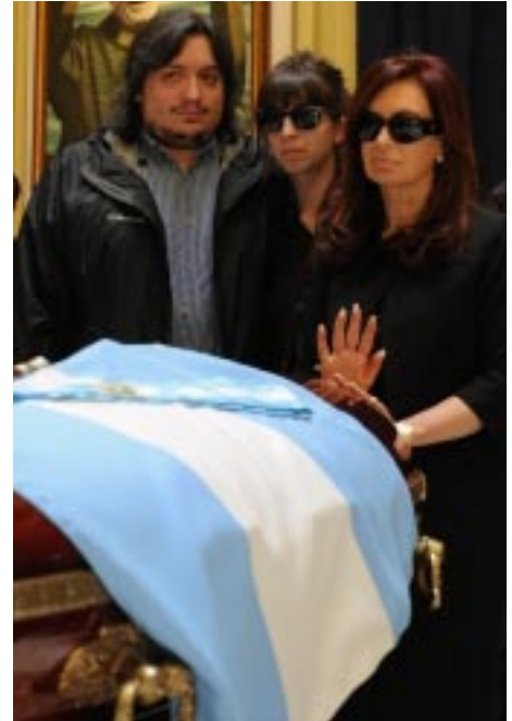
La presidenta Cristina Fernández y sus hijos Máximo y Florencia, despiden al ex presidente Néstor Kirchner, en el Salón de los Patriotas Latinoamericanos del Bicentenario de Casa Rosada.

La presidenta Cristina Fernández, viuda de Kirchner, mantiene en su Gobierno esa misma orientación, que se nutre de la his-