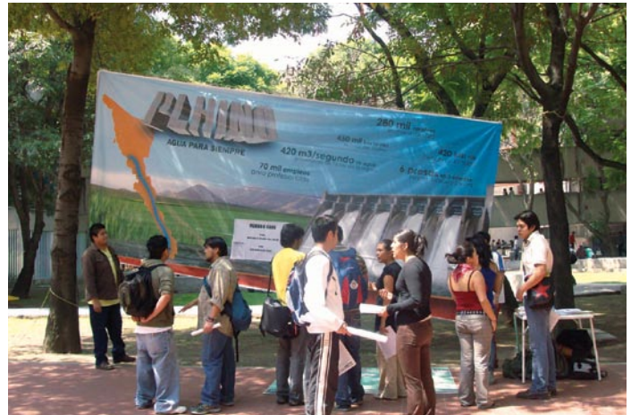
Organizadores del LYM en Ciudad de México en campaña por el Plan Hidráulico del Noroeste (PLHINO), en junio de 2009. Este proyecto para el fértil pero árido noroeste de México está listo para echarse andar y enlazaría a la perfección con NAWAPA.

Este narcotráfico, que es un viejo truco británico, y es un truco específicamente británico, lo ponen en práctica en México en contra tanto de México como de Estados Unidos. Y de nuevo, el empobrecimiento del pueblo de México, en general, se convierte en la base que alimenta el narcotráfico. Hay gente que no tiene ingresos