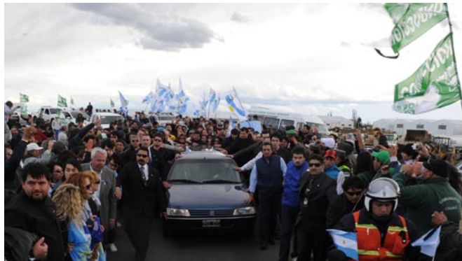
Una multitud acompaña el cortejo fúnebre de Néstor Kirchner en Río Gallegos.

Esta manifestación enorme de amor y respeto por Kirchner es consecuente. Luego de tomar posesión en mayo de 2003, le dejó en claro al FMI que no tenía la intención de imponer las políticas de austeridad que le estaban exigiendo. ¿Por qué someter a la población argentina al mismo tipo de políticas que habían causado la crisis en primer lugar?, declaró firmemente. El desempleo andaba por 25%; la tasa de pobreza en la otrora próspera nación era de 57%, algo sin precedentes. El país está “en el infierno” dijo, y la primera prioridad es sacar a la población de ahí, no empujarlos peldaños más abajo. Cuando Kirchner dejó el cargo en el 2007, informó feliz que los argentinos habían logrado por lo menos salir del infierno y llegar al purgatorio. Pero todavía hay mucho camino por recorrer, advirtió cauteloso.