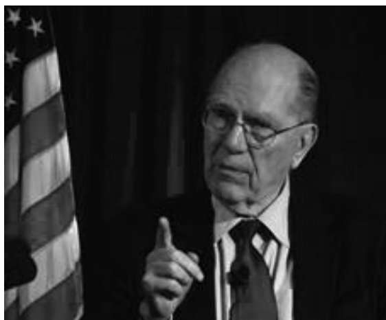
Lyndon H. LaRouche.

Así que, lo que ha sucedido es que ha hecho erupción un movimiento popular que se extiende desde el norte de África hacia Estados Unidos, donde ahora domina el crecimiento de un movimiento de huelga de masas. Lo de Wisconsin ha cobrado fama, por supuesto, pero también ocurre en varios otros estados. Va a extenderse. Es una huelga de masas que no puede controlarse por medios convencionales. Es un movimiento de veras revolucionario. Ahora mismo es un lío del demonio, muy parecido a los tejemenes de la Revolución Francesa. [...]