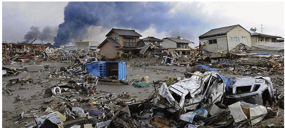
La costa este del norte de Japón, destruida por el tsunami, no por los reactores nucleares.

Merkel capituló ante las mentiras verdes y tomó medidas en contra de la industria nuclear alemana, entre ellas, el cierre casi inmediato de siete nucleoelectricas. Esto solo provocó furia en las bases de la propia CDU, que favorecen la energía nuclear, y redujo así su propio voto en el estado.