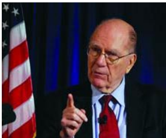
Lyndon H. LaRouche.

Así que, lo que ha sucedido es que ha hecho erupción un movimiento popular que se extiende desde el norte de África hacia Estados Unidos, donde ahora domina el crecimiento de un movimiento de huelga de masas. Lo de Wisconsin ha cobrado fama, por supuesto, pero también ocurre en varios otros estados. Va a extenderse. Es una huelga de masas que no puede controlarse por medios convencionales. Es un movimiento de veras revolucionario. Ahora mismo es un lío del demonio, muy parecido a los tejemenes de la Revolución Francesa. [...]