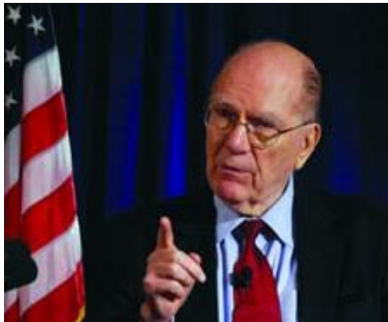
Lyndon H. LaRouche.

Así que, lo que ha sucedido es que ha hecho erupción un movimiento popular que se extiende desde el norte de África hacia Estados Unidos, donde ahora domina el crecimiento de un movimiento de huelga de masas. Lo de Wisconsin ha cobrado fama, por supuesto, pero también ocurre en varios otros estados. Va a extenderse. Es una huelga de masas que no puede controlarse por medios convencionales. Es un movimiento de veras revolucionario. Ahora mismo es un lío del demonio, muy parecido a los tejemenes de la Revolución Francesa. [...]