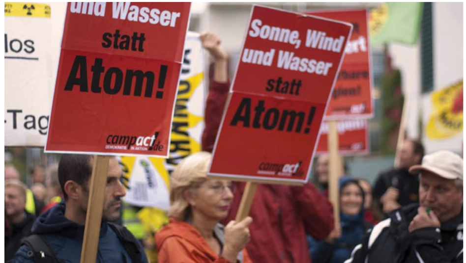
Los lunáticos verdes en Alemania demandan la prohibición de la energía nuclear para sustituirla con energía solar, eólica y demás, lo cual reduciría drásticamente la productividad de la economía alemana y reduciría los niveles de vida de Alemania a los del Tercer Mundo.

Zepp-LaRouche recalcó que esta falta total de conducción en el país en defensa de defender los intereses vitales de la nación alemana, se vio claramente en las semanas previas a las elecciones. La Unión Demócrata Cristiana (CDU), el partido de la canciller alemana Ángela Merkel, que había gobernado en Baden-Wurtemberg por 58 años, sabía que iba a tener problemas en la elección estatal. ¿Peleo para defender la importante industria de máquinas-herramienta de ese estado, y el principio de progreso económico? Al contrario; la propia