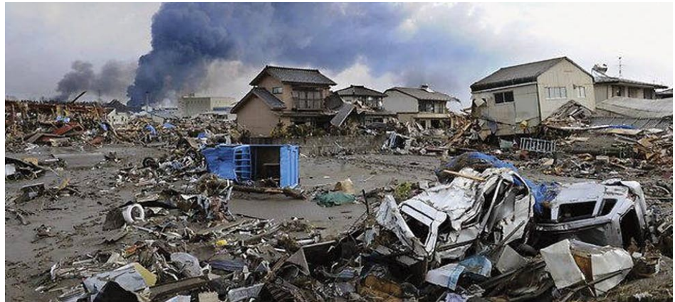
La costa este del norte de Japón, destruida por el tsunami, no por los reactores nucleares.

Merkel capituló ante las mentiras verdes y tomó medidas en contra de la industria nuclear alemana, entre ellas, el cierre casi inmediato de siete nucleoelectricas. Esto solo provocó furia en las bases de la propia CDU, que favorecen la energía nuclear, y redujo así su propio voto en el estado.