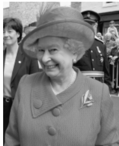
La reina Elizabeth II controla el sistema financiero, pues es dueña de las islas Caimán.