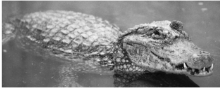
Si el caimán no te come, los especuladores financieros de las Islas sí lo harán.

• Los senadores Carl Levin y Norm Coleman —el presidente y alto miembro de la Subcomisión Permanente de Inves-