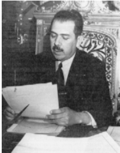
La alianza del Buen Vecino entre los presidente de EU y México, Franklin Roosevelt y Lázaro Cárdenas, respectivamente, siempre fue el blanco histórico de los ataques de los franquistas españoles y los nazis, de su Unión Nacional Sinarquista en México, y de los intereses de la familia Buckley en este mismo país.

Fox. El actual presidente del PAN, Luis Felipe Bravo Mena, es un seguidor de Blas Piñar, al igual que el dirigente panista Felipe Calderón, quien está pensando candidatearse a la Presidencia de México por el PAN para suceder a Fox.