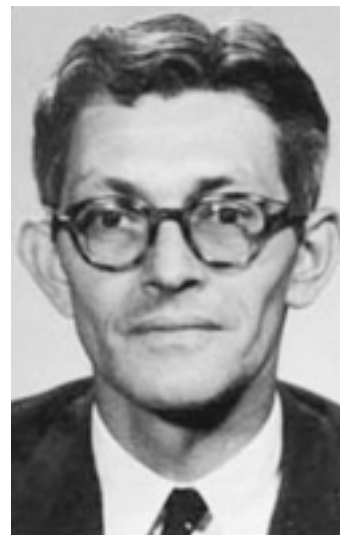
El director de la CIA Allen Dulles (izq.) y su director de contrainteligencia James Jesus Angleton (der.) impulsaron el auge de los (muy antiamericanos) grupos sinarquistas en México.

del 11 de marzo en España ocurrieron la víspera de las elecciones nacionales, en las que resultó derrotado el partido de Aznar.