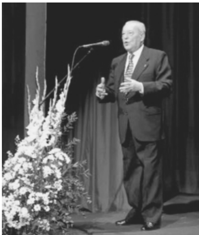
El fascista franquista Blas Piñar de España, quien es el mentor ideológico de la pandilla de Quijano, lleva años reagrupando y movilizand a grupos fascistas “pequeños pero musculares” —incluso de perfil terrorista— en España, Italia e Iberoamérica alrededor del grupo de Piñar, Frente Español.

La función central, aunque subalterna, de Quijano en el resurgimiento neonazi, y la amenaza resultante de terrorismo