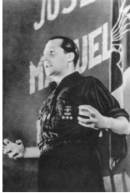
El ideólogo y fundador de la Falange Española José Antonio Primo de Rivera es otro de los ídolos de la pandilla de Quijano.

1 de noviembre de 1937: El primer comité regional de la Unión Nacional Sinarquista en los EU se establece en Los Ángeles, California. Otros comités regionales son establecidos en Bakersfield, California, y en El Paso y McAllen, Texas. Llegan a establecerse más de 50 comités locales en los EU.