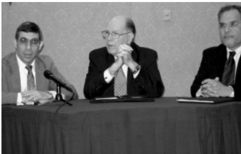
LaRouche habla el 31 de marzo en Monterrey, México, con un grupo de sindicalistas, personalidades políticas, educadores, simpatizantes y otros de todo el país. Lo acompañan en el podio Dennis Small (izq.), quien llevó a cabo la interpretación del inglés al español, y Benjamín Castro (der.), el moderador de la reunión.

Así que en todo el hemisferio tenemos el potencial de erigir entre las naciones un movimiento pujante entre los adultos jóvenes. Y he estado trabajando en cómo hacer eso; y está funcionando. Y lo que haremos en el período venidero, es tratar de acelerar este proceso. Los grupos de jóvenes serán