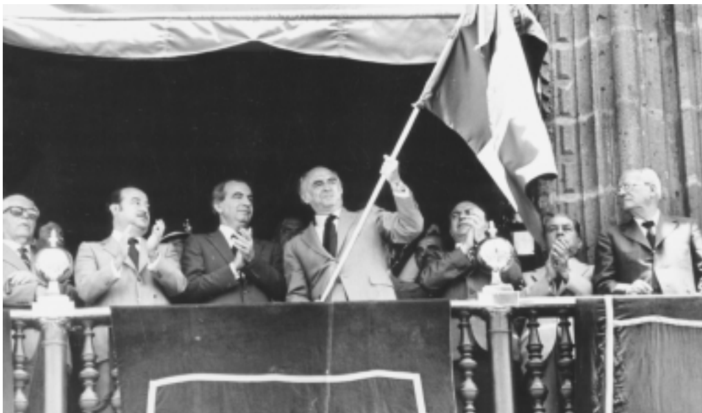
El presidente mexicano José López Portillo ondea la bandera nacional el 3 de septiembre de 1982, en una manifestación de apoyo a la nacionalización de la banca. El resto de los gobiernos de Iberoamérica dejaron solo a México, y las iniciativas de López Portillo fueron aplastadas. (Foto: Coordinación de Material Gráfico).

medidas de emergencia necesarias para evitar que un desplome financiero devenga en una catástrofe social.