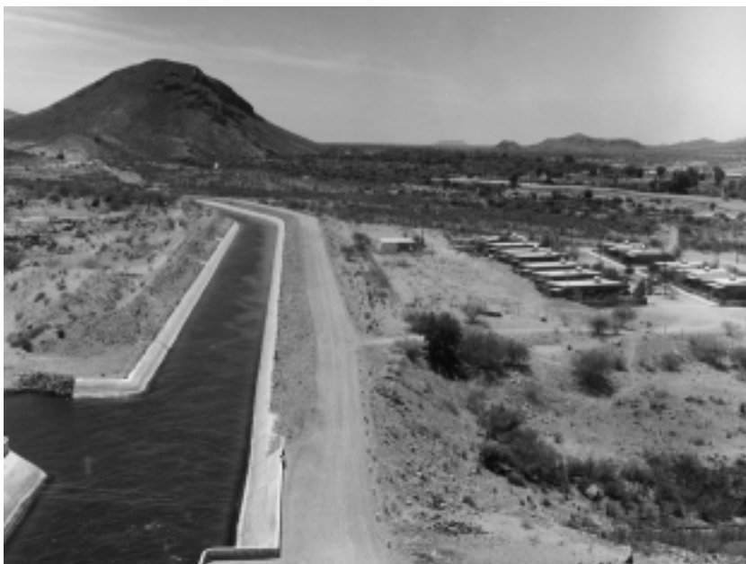
Canal de irrigación alimentado por la presa Álvaro Obregón en Sonora, México. El problema más grande de México es el agua, y la única salida es desarrollar la tecnología de desalación nuclear. (Foto: Naciones Unidas).

el “Tec”. 1 En general, cualquier persona en el mundo que comprenda los problemas mundiales está de acuerdo ahora en regresar pronto a la inversión en energía nuclear. Esto no sólo se debe al precio del petróleo. El petróleo tiene un futuro limitado en tanto mero combustible; tiene un destino importante en tanto insumo químico. En cambio, tenderemos a ir en pos de combustibles que se producen mediante la fisión nuclear. En tanto acuerdo general, estamos regresando a la energía nuclear, y más o menos con rapidez: esto es China, esto es Rusia, esto es Francia, esto es Brasil, etc. Hay un entendimiento general de que vamos de regreso a una economía fundada en la energía nuclear, en tanto perspectiva.