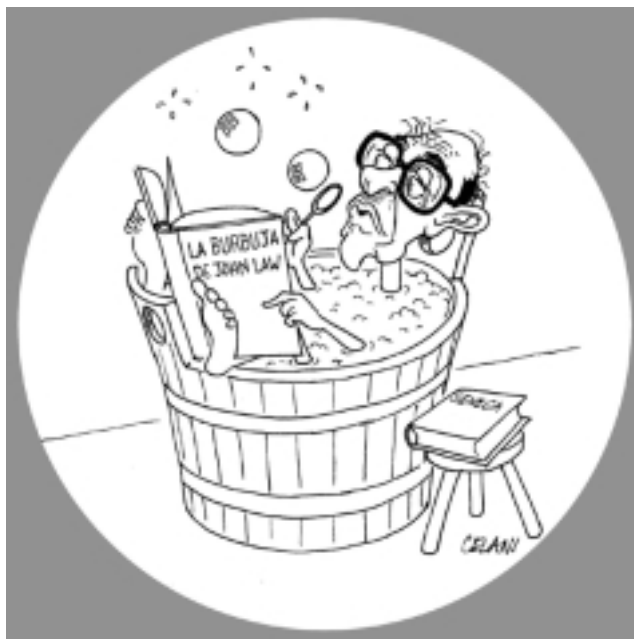
La burbuja a la John Law que creó el ex presidente de la Reserva Federal de EU, Alan Greenspan, es simplemente impagable.

En la civilización europea moderna, desde el Renacimiento del siglo 15 y el establecimiento de Estados republicanos en Francia, con Luis XI, y en Inglaterra, con Enrique VII, y