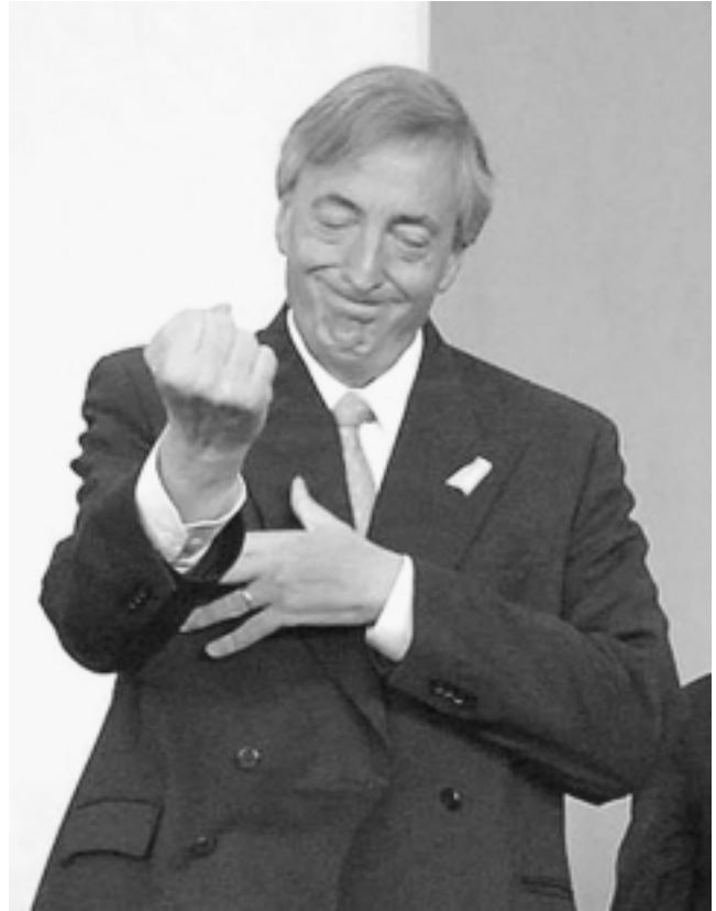
El presidente argentino Néstor Kirchner ha venido enfrentando, con éxito, a los buitres financieros internacionales que no sólo quieren acabar con su nación, sino con el continente entero. Kirchner ataca el 2 de abril a las fuerzas internacionales del “nacionalismo ultramontano” que arrastraron a Argentina a la desastrosa guerra de las Malvinas.

Lo que ha pasado en virtud de esta decisión de parar el crecimiento de la burbuja, significa que, en esencia, el acarreo de fondos va a derrumbarse. Por ejemplo, Islandia acaba de irse a la quiebra, Nueva Zelanda, Australia está a punto. La