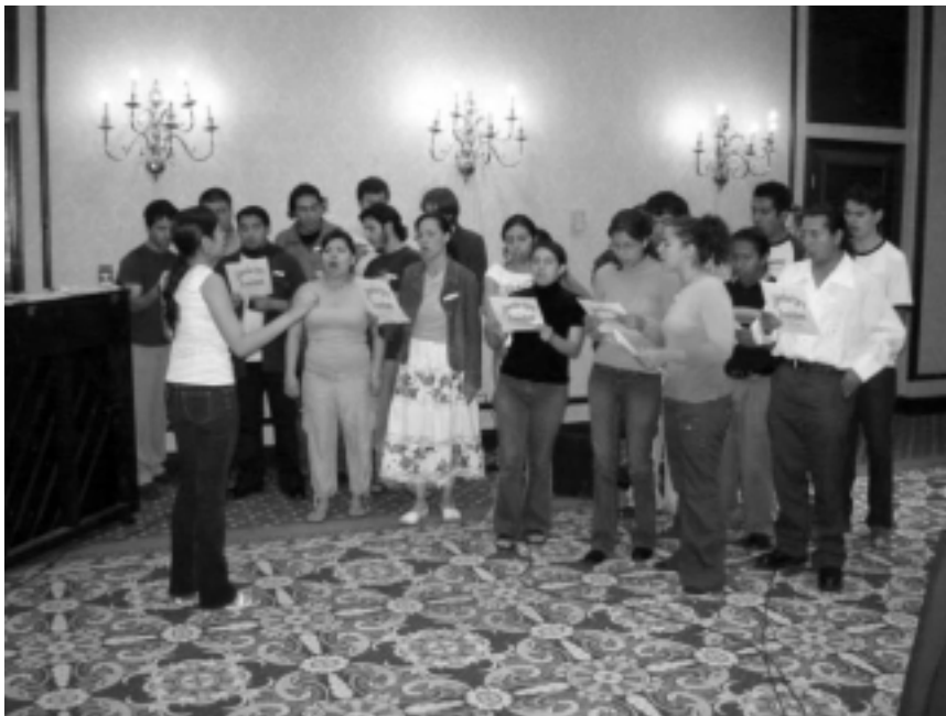
“El proceso social ideal es la música coral, la música coral clásica, cuando es rigurosa. . . Y la música funciona como por arte de magia, esta clase de canto”. El Movimiento de Juventudes Larouchistas canta el 1 de abril, en una reunión que tuvieron con LaRouche en Monterrey.

armadas estadounidenses con fuerzas mercenarias bajo el mando de firmas financieras, lo que, para quienes sabemos de esto, significa un retorno al concepto de la SS de los nazis.