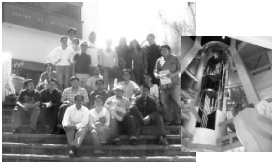
Miembros del Movimiento de Juventudes Larouchistas visitaron a mediados de abril la nucleoelectrónica de Laguna Verde, ubicada en el estado mexicano de Veracruz, donde pudieron apreciar modelos de tamaño natural de las partes del reactor.

Así comenzó nuestra travesía hacia la energía del núcleo atómico. De entrada, nuestros anfitriones nos pidieron que les platicáramos más sobre nuestro movimiento. Después proyectaron un video que muestra el procedimiento de recarga de combustible nuclear para la planta. Posteriormente, un ingeniero nos llevó a ver algunos modelos de tamaño natural (de uso pedagógico) de algunas