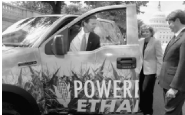
A la sombra del Capitolio estadounidense, el senador republicano John Thune (de Dakota del Sur) y el representante republicano Jeff Fortenberry (de Nebraska) no tienen ningún empacho en montarse al carro del etanol, pero es el pueblo estadounidense el que pagará los platos rotos.

Esta cantidad increíble de tierra tiene sin cuidado a las muchas empresas que están intoxicadas con la perspectiva de recibir subsidios gubernamentales para la destilación de