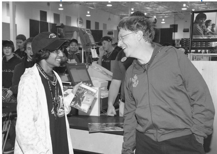
Bill "Columbine" Gates alienta a uno de sus alegres reclutas para la revolución en los asuntos militares.

Para ponerle el último clavo virtual a los ataúdes de Facebook, veamos ahora al nuevo necrófago principal de Facebook, Bill Gates de Microsoft. 10 Contrario a la mitología popular, Gates no es la prueba del éxito de la globalización, sino todo lo contrario. La mente y la moral de Gates son típicos de la corrupción satánica que representa la globalización, y sirve como alerta para los ciudadanos de esta república que no son estúpidos, de que algo salió terriblemente mal. Para empezar ve la fiesta de Halloween del "Día del Juicio Final" de Microsoft de 1995, que Gates organizó para celebrar que acababa de hacerse del